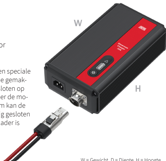
W = Gewicht, D = Diepte, H = Hoogte

Hij wordt geleverd met een speciale klem op de plus-kabel, die gemakkelijk kan worden aangesloten op het 12V aansluitpunt onder de motorkap van het voertuig gesloten kan worden wanneer de lader is aangesloten.